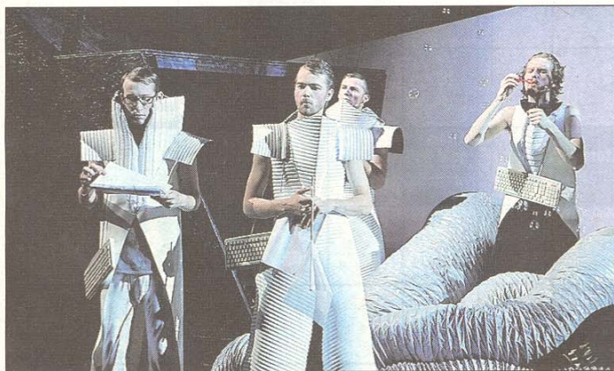
Kriegsberichterstatte überzeugen darstellerisch, optisch & akustisch