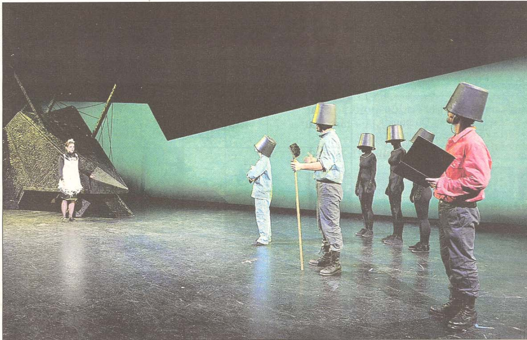
Einfache Mittel, große Wirkung: die KUG-Studierenden begeistern in einer Szenen-Collage nach Kraus