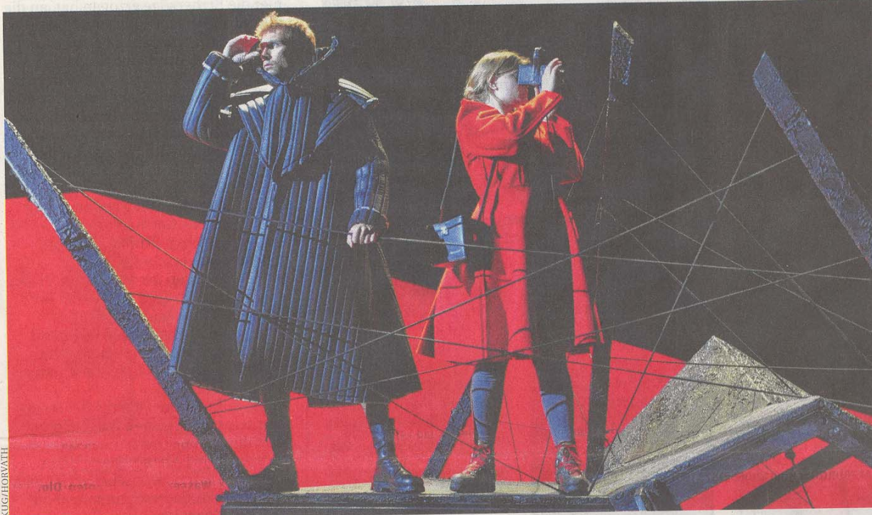
Berichte von der Front: An der Kunst-Uni Graz werden Karl Kraus' „Letzte Tage der Menschheit“ von 100 Studierenden aufgeführt

„Alice Schalek – Die letzten Tage der Menschheit“, 7., 9., 10. und 11. Mai, Kunstuniversität Graz. Karten: 16 Euro, ermäßigt 8 Euro. www.kug.ac.at