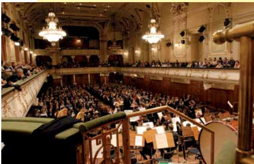
Orchesterkonzert im Stefaniensaal

U mfangreiche öffentliche Auftritte ihrer Studierenden machen die Kunstuniversität Graz, auch im internationalen Vergleich, zu etwas Besonderem. Wir wollen auch in der Abosaison 2010/11, veranstaltet von der Gesellschaft der Freunde der KUG, mit insgesamt 18 Veranstaltungen (+ vier Kinderabo-Nachmittagen) wieder möglichst vielen Studierenden die Chance geben, vor einem kritischen Fachpublikum künstlerische Reife und Reputation zu erlangen. Darüber hinaus leisten wir als verantwortungsvoller Kulturveranstalter einen wesentlichen Beitrag zur Weiterentwicklung der regionalen Identität unseres Kulturraumes. Bei der Zusammenstellung der Programme wurde zudem versucht, unserem Publikum Einblick in die künstlerische Vielfalt der universitären KUG zu geben.