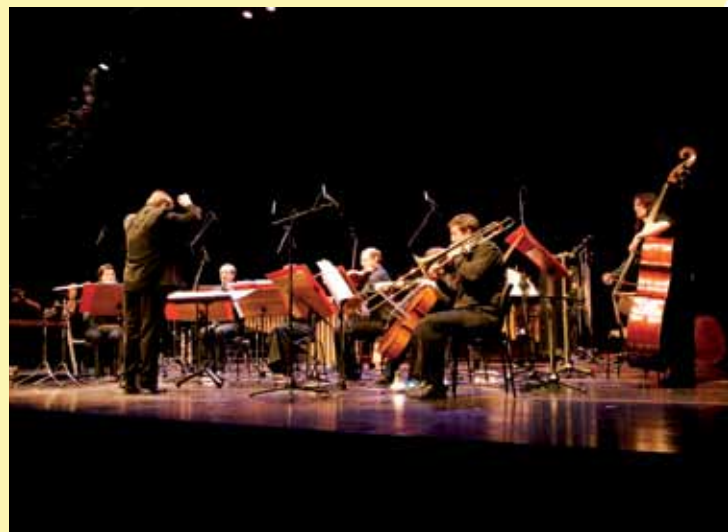
Neue Musik im MUMUTH

Beide Abonnements sind, genauso wie das Hauptabonnement und das abo@MUMUTH, bzw. die Kombination aus beiden „KUG total“ und das Kinderabo in der Veranstaltungsabteilung erhältlich – für Mitglieder der Gesellschaft der Freunde der KUG zu einem ermäßigten Preis!