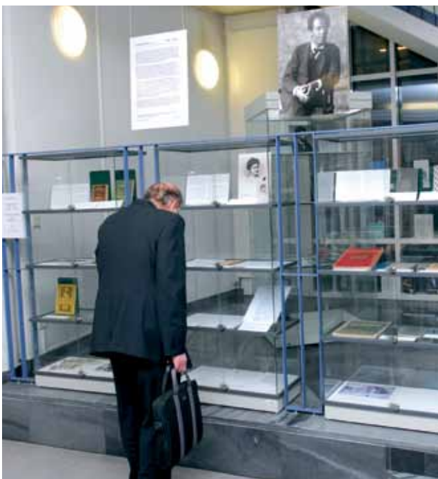
Mahler-Ausstellung in der KUG-Bibliothek