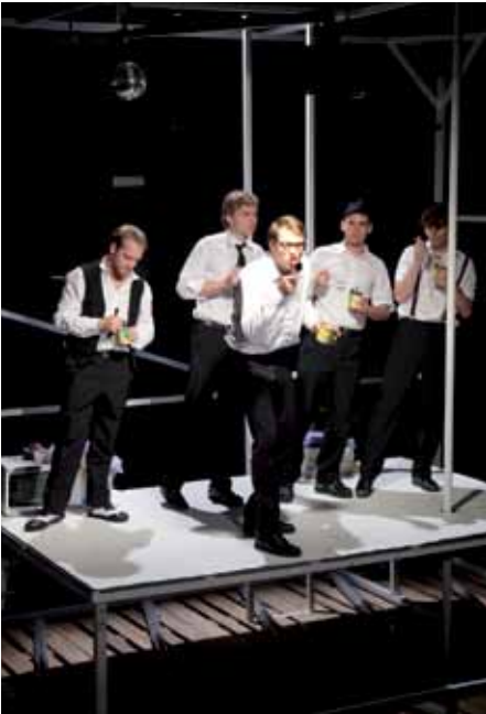
MOBY DICK: Ensemble