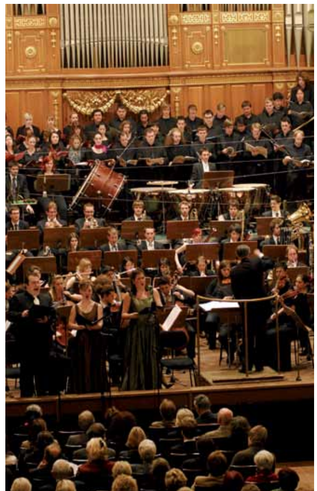
Konzert im Stefaniensaal