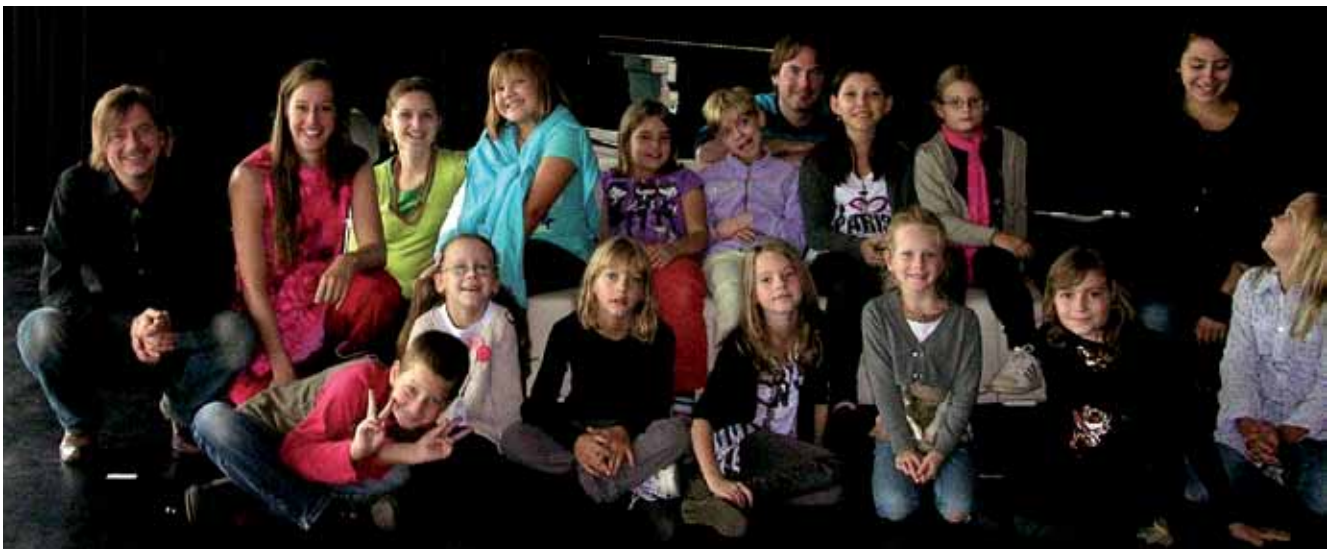
FRida & freD-Sommerakademie: Führung im MUMUTH, August 2010